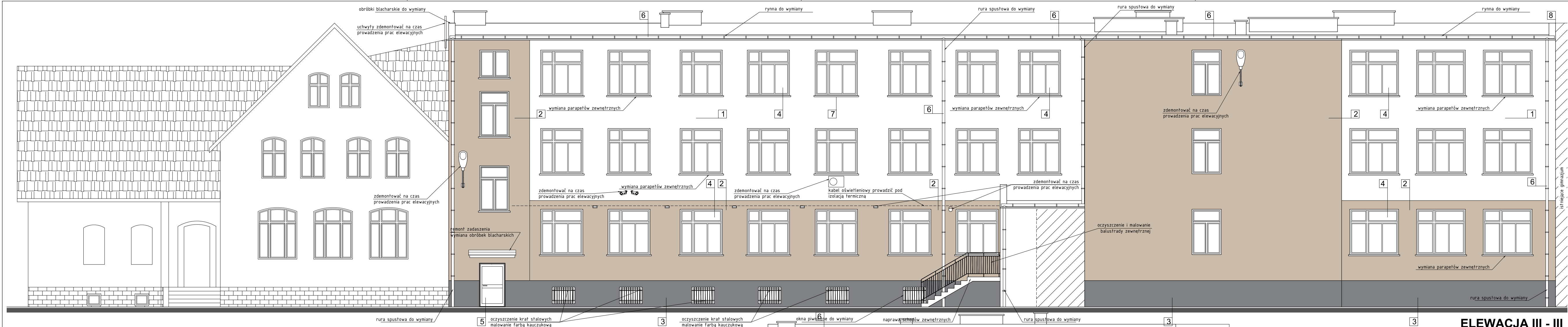
ELEVACJA III - III